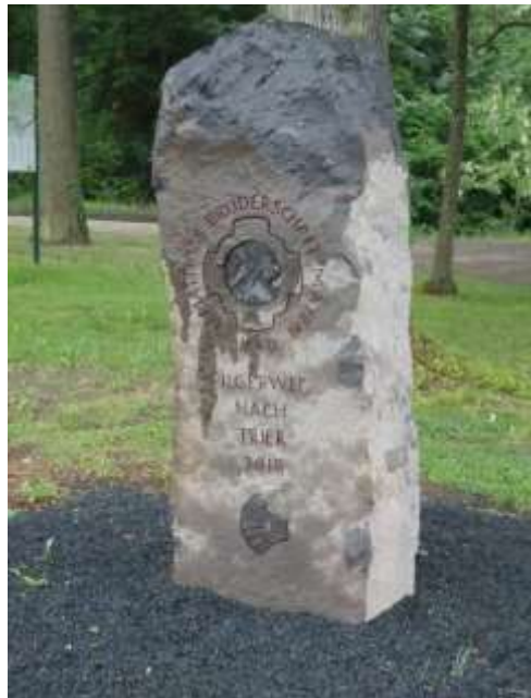
Neue Pilgerstele am Forstamt in Quint