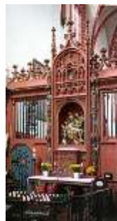
Gnadenkapelle in der Wallfahrtskirche in Klausen

Grab des hl. Matthias in der Matthiasbasilika in Trier