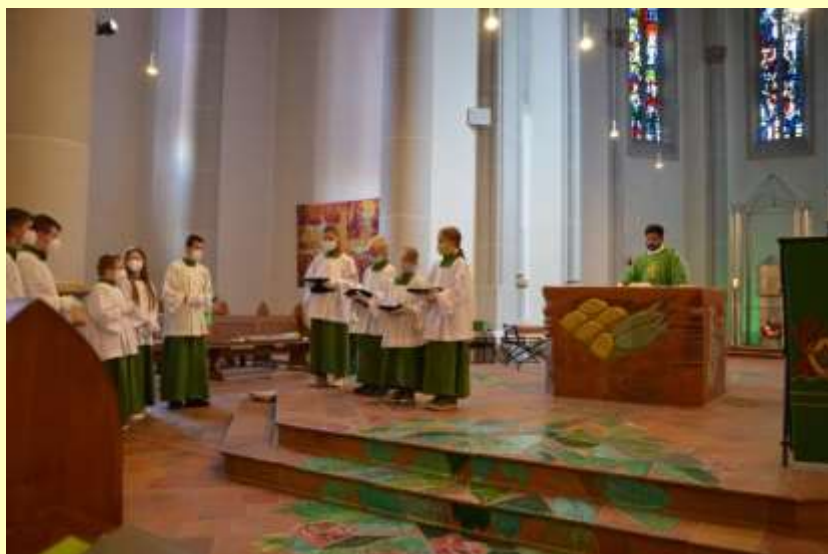
Einführung der neuen Messdiener in St. Peter